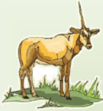
أعضاء المها مكتملة

الآحظ الناقص في كل صورة ، ثم أتمم جملته الاستثناء كما في المثال الأول :