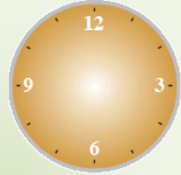
الساعة مكتملة إلا عقاربها